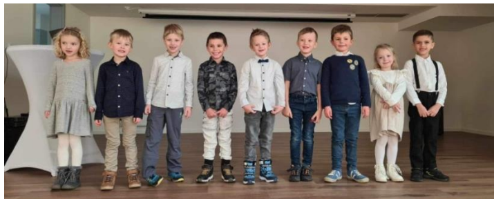
Účast dětí ze třídy Žabiček na akci Vítání občánků v obci, listopad 2023

Z Operačního programu Jana Ámose Komenského financujeme pozici školního asistenta a vzdělávání pedagogů mateřské školy.