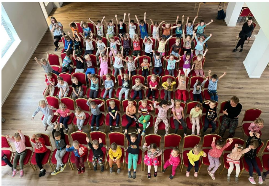
Divadelní představení poprvé v prostorách rekonstruovaných obecních prostor, květen 2024