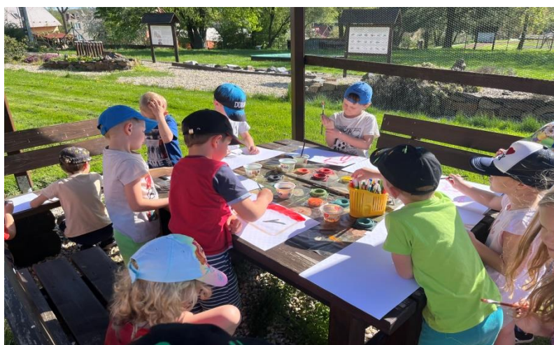
Učení a činnosti jsou realizovány venku, květen 2024