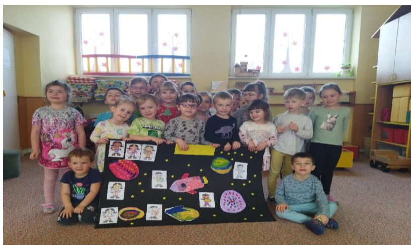
Třída Sluníčka, jaro 2024, společná práce dětí 2-7 let

Počet zapsaných dětí v MŠ po zápisu v květnu 2024: 85, z toho 12 dvouletých dětí.