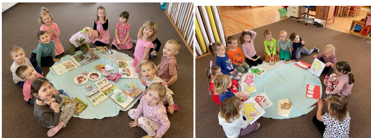
Činnosti v kruhu ve třídě Rybiček, 2023/2024