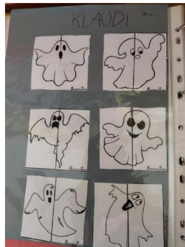
Příklad stránek z portfolia dítěte, školní rok 2023/2024

Pro vedení matriky a zkvalitnění komunikace s rodiči jsme pořídily aplikaci Digiškolka. Dařilo se nám vést údaje v matrice, posílat pravidelné hromadné zprávy rodičům.