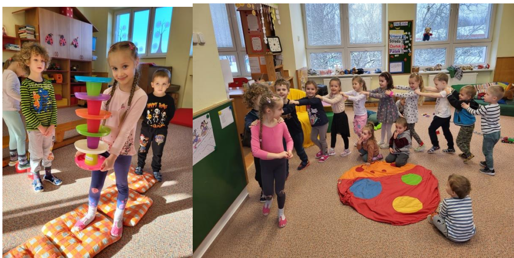
Děti ze třídy Berušek, zima 2023

V mateřské škole jsou oblasti, které je třeba rozvíjet průběžně a je třeba využívat situační učení. Základem pro osobnostní a sociální výchovu jsou věkově smíšené třídy. Učitelky s dětmi vytvářely společně pravidla, jejichž dodržování zajišťovalo rovný přístup ke všem, rozvíjela se spolupráce s rodinami. Podporovaly jsme zdravý životní styl vlastním vzorem i v tématech. Pro rodiče jsme úkoly preventivních činností zveřejňovaly na nástěnkách tříd, abychom je s nimi také seznámily. Naše záměry v oblasti prevence rizikového chování jsme průběžně realizovaly a zaznamenávaly je do třídních knih. Máme z předchozího roku inovovaný Minimální preventivní program. Učitelé jej s novým školním rokem využívali k průběžným činnostem i k zařazování témat.