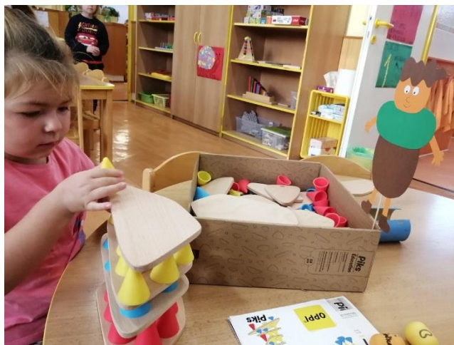
Nová stavebnice – práce s nakloněnou rovinou a třením, podzim 2024

Všechny třídy jsou vybaveny sedacím nábytkem ve vhodné výšce a velikosti pro předškolní děti, vhodným nábytkem pro uložení hraček a potřebných učebních pomůcek. Součástí tříd je sociální zázemí. Průběžně je dokupován materiál a doplňovány a obnovovány učební pomůcky a aktuální literatura, každá třída odebírá pro děti pravidelně časopisy. Učební pomůcky a vybavení je pořizováno pro činnosti ve třídách i pro pobyt venku. Při činnostech učitelé využívají k tvoření a k pokusům běžný materiál (mouku, ocet, olej, kostkový cukr, prášek do pečiva, sodu, koření, fazole, kávu, krupici...). Učitelé si také pomůcky vyrábějí sami, k vytváření různých dovedností dětí.