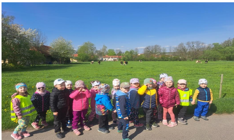
Děti ze třídy Rybiček na vycházce, jaro 2024