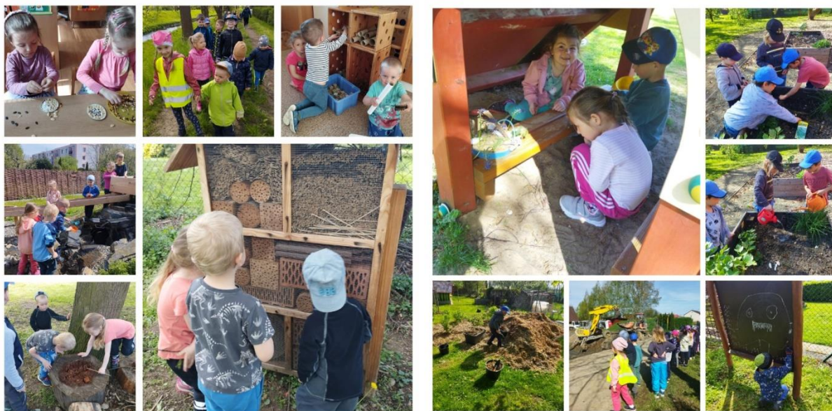
Kampaň Ekoškoly, duben 2024