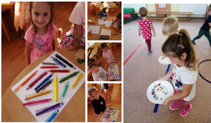
Učíme se pomocí skutečných věcí, prožitkem, třída Sluníčka, podzim 2023

Během školního roku jsme se zapojily do kampaně Ekoškoly. Zapojily jsme třídy i rodiny dětí. Témata Ekoškoly jsme zařazovaly do vzdělávání. Úspěšná byla naše účast na konferenci základní školy Biodiverzita v Kuníně.