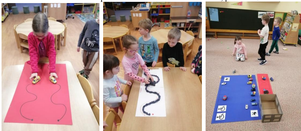
Výroba pomůcek učiteli k rozvoji dovedností dětí (vizuomotorika, spolupráce hemisfér, řazení...), jaro 2024.

Učitelé, rodiče, i Česká školní inspekce projevili zpravidla spokojenost s vybavením a vzhledem tříd a prostor školy. Abychom mohly pořídit pestrou škálu pomůcek a zároveň nakládali hospodárně s finančními prostředky, pořizujeme pomůcky v jednom nebo dvou provedeních a půjčujeme si je mezi třídami.