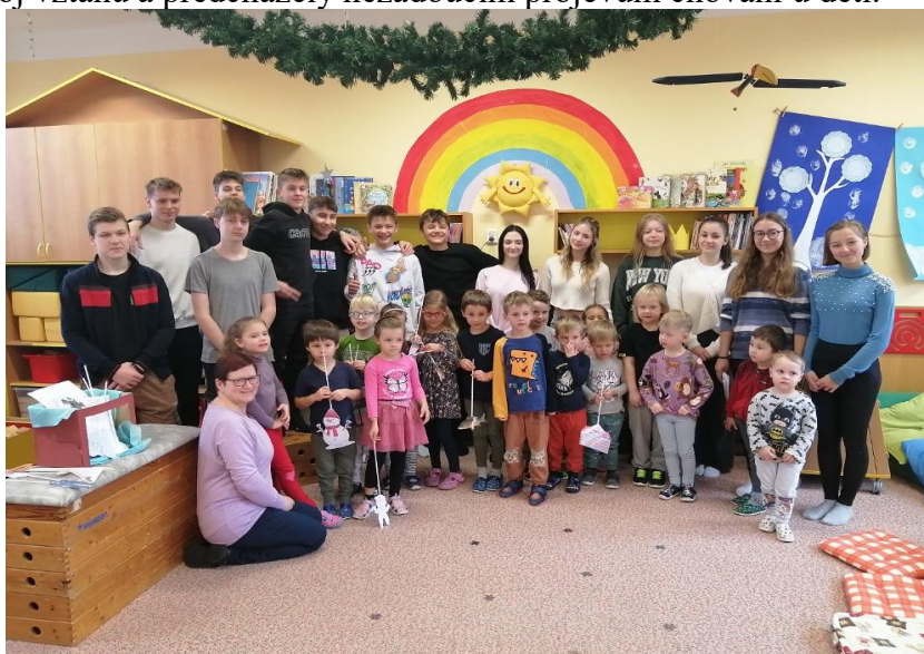
Školáci hrají ve školce dětem divadlo, prosinec 2023

Spolupracovaly jsme se základní školou, díky setkávání a poznávání jsme podporovaly rozvoj vztahů a předcházely nežádoucím projevům chování u dětí.