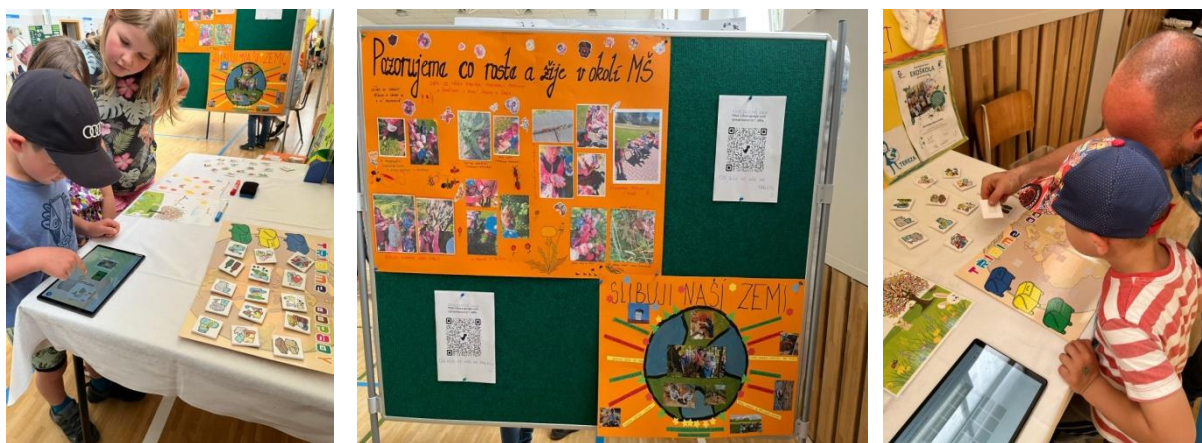
Stánek MŠ na konferenci Biodiverzita v Kuníně, květen 2024

Během školního roku jsme se zapojily do kampaně Ekoškoly. Zapojily jsme třídy i rodiny dětí. Témata Ekoškoly jsme zařazovaly do vzdělávání. Úspěšná byla naše účast na konferenci základní školy Biodiverzita v Kuníně.