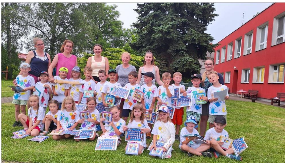
Noc ve školce s pasováním předškoláků, červen 2024