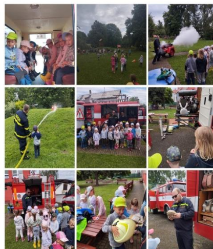
Ukázka práce dobrovolných hasičů z Hukovic, červen 2024, zahrada Pastelkové školky